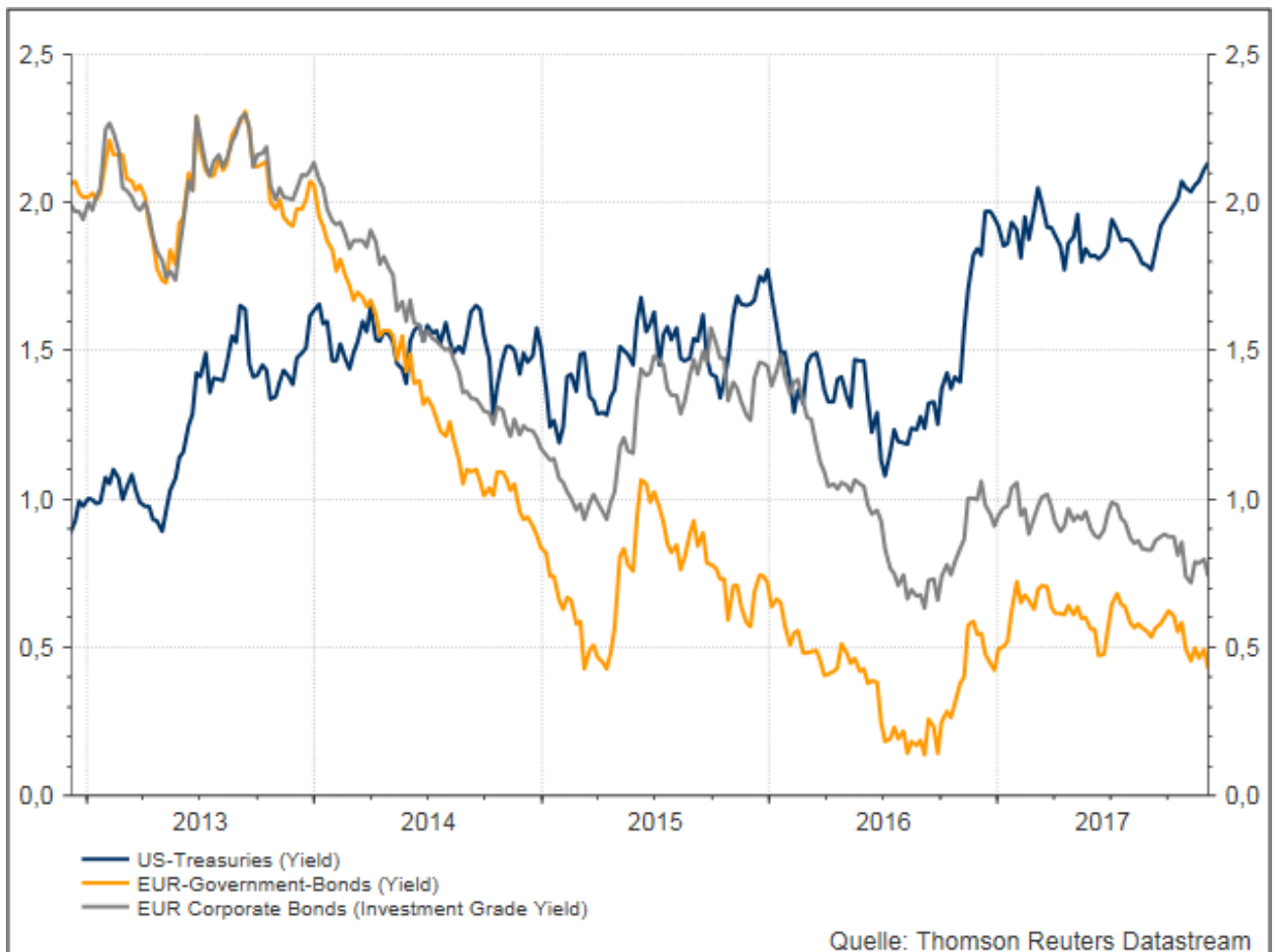
Development of bond yields of European High-Yield-Bonds compared with global High-Yield-Bonds and Emerging-Markets-Corporate-Bonds (11/2012-11/2017)