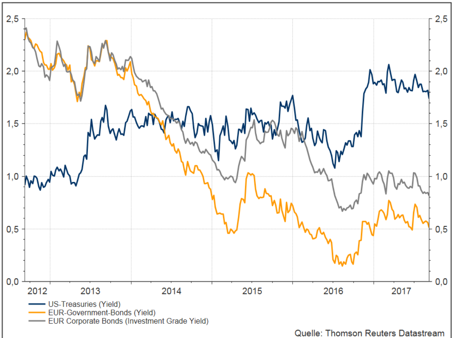
Development of bond yields of European High-Yield-Bonds compared with global High-Yield-Bonds and Emerging-Markets-Corporate-Bonds (08/2012-08/2017)