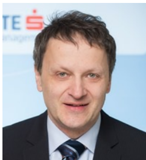
Author: Anton Hauser Senior Fundmanager Emerging Market Bonds

Three and a half years after introduction, the Czech National Bank decided today to remove its 27 CZK/EUR currency floor. Many investors were expecting this decision. Indeed, this trade is currently one of the most popular ones among investors. As expected, the Czech koruna appreciated slightly against the Euro. In the short term the currency will remain volatile, as a lot of speculative money is involved. In the long run I expect that the Czech koruna will continue to appreciate given the strong fundamentals of the Czech economy.